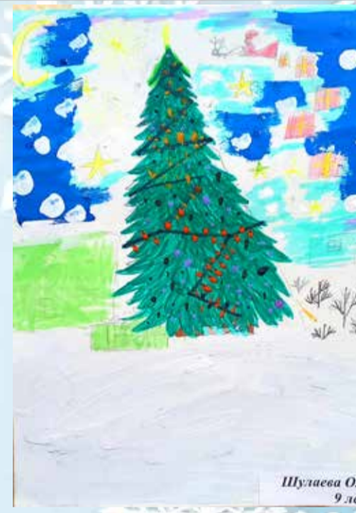
Шуляева Оля 9 лет