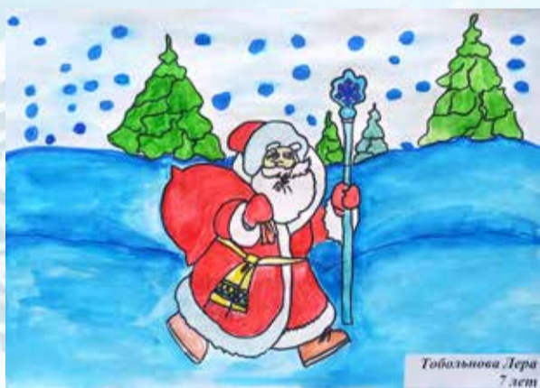
Товальцова Лера 7 лет

В преддверии новогодних и рождественских праздников в АО «Омский речной порт» провели творческий конкурс детских рисунков и поделок на тему «Новогодняя сказка». Цель данного мероприятия – создание праздничного настроения и новогодней сказки в организации! В творческом конкурсе приняли участие дети и внуки работников организации в возрасте от 4 до 14 лет. Представленные работы получились яркими и красочными. Дети в своих рисунках и поделках изобразили новогоднюю сказку, елку – главную красавицу Нового года, главного героя Деда Мороза, спешащего принести в каждый дом радость и праздничную атмосферу. Рисунки и поделки украсили