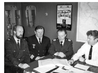
Всех причастных – с юбилеем! Стр. 2