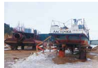
Скоро давать габарит! Стр. 4