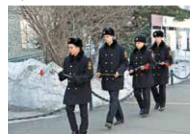
Патриотический форум «Искра» Стр. 4