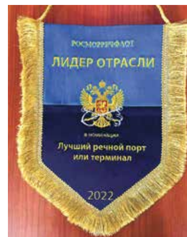
Омский порт – «Лидер отрасли» Стр. 1,3