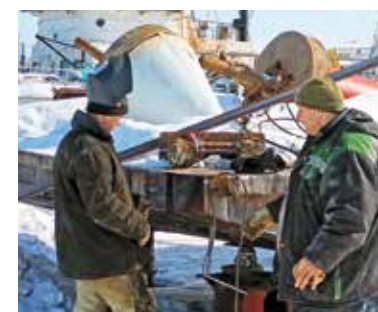
Горячая пора Стр. 3