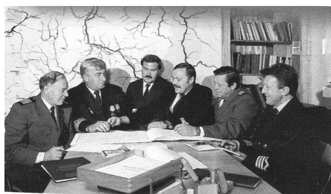
Государственные инспекторы Омского линейного отдела

Сегодня преемником Омского линейного отдела Обь-Иртышского управления государственного морского и речного надзора, Государственной речной судоходной инспекции является Территориальный отдел госморречнадзора по Омской области. В конце 2022 года он вошел