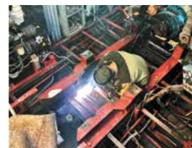
Приоритетные задачи Стр. 2