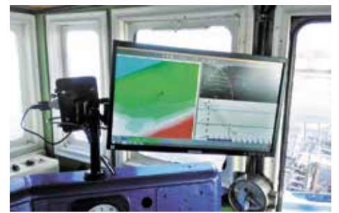
Рабочее место багермейстера

для ускорения внедрения ЭНК, повышения эффективности сбора, обработки данных и их корректировки. Результаты проведенных работ будут способствовать процессу доведения до конечного пользователя электронных навигационных карт внутренних водных путей Российской Федерации и позволят сформировать единые принципы их корректировки на судах ВВП. Эффект выразится в повышении уровня безопасности судоходства за счет создания организации картографической деятельности в структуре Росморречфлота, что в конечном итоге приведет к своевременной актуализации электронных и бумажных навигационных карт соответствующих участков ВВП РФ.