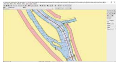
Фрагмент ЭНК р. Иртыша