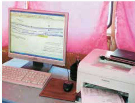
Рабочее место камеральной обработки АПК

В последнее время все активнее идет подготовка к внедрению электронных навигационных карт, совместно с Росморречфлотом ведется разработка нормативной технической базы, регламентирующей осуществле-