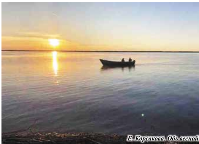
Е. Корсакова. Обь весной