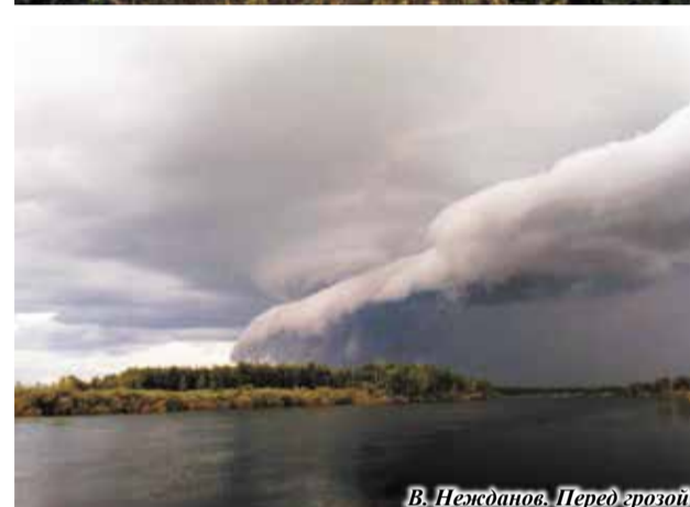
В. Нежданов. Перед грозой