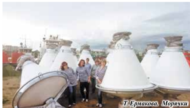
Т. Ермакова. Морячки

Благодарим всех, кто принял участие в фотоконкурсе, и поздравляем призеров!