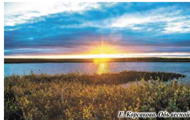
Е. Корсакова. Обь весной